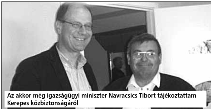
Az akkor még igazságügyi miniszter Navracsics Tibort tájékoztattam Kerepes közbiztonságáról

Előző számokban megkezdtem a „sárba tiprás helyett a városunkhoz méltó módon” lényegre térést és kampányolást. Ez pedig kérem, csak egyre keményebb lesz. „Én csak azt mondom, Pelikán elvtárs, a nemzetközi helyzet egyre fokozódik. Ugye, Virág elvtárs megmondta: „A torkánál ragadta meg a kérdést Pelikán elvtárs.” Ő pedig csak tudta, közel volt a tűzhez. Azaz Bástya elvtárshoz. A kerepesi bástyák megremegni látszanak. Már nem a régi a magyar narancs sem. Citromízű még a banán is, mert unja már sok mindenki. De mit is lehet tenni itt Kerepesen? Ki olvassa a Való Véleményt és hallgatja a Kerepes rádiót a 97,1-en? Rengetegen, szinte mindenki. Kerepes egyetlen autentikus és szórakoztató rádiója nem csak zenél, hanem bizony van ám ott sok minden, ami nem fér bele a helyi közpénzen