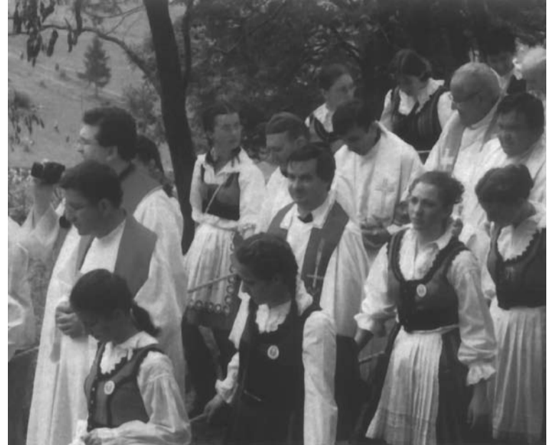
Miseruha és hagyományos népviselet

A magyarság és a székelység meghatározó ünnepe mára a nemzet összetartozásának jelképévé vált. Az idei búcsú a 439-ik. A körmenetet a gyergyóalfalvi keresztalja vezette annak emlékére, hogy István pap 1567-ben hadba vonult a katolikus hit védelmében. Az idei búcsú jelmondata egy Mária-ének részlete: „Szent Fiadat Boldogasszony kérd e népért” volt. A misét hagyományosan a Somlyóhegyén a Hármashalom-oltárnál tartották, s külön szentmisét mondtak a moldvai csángó magyarok számára.