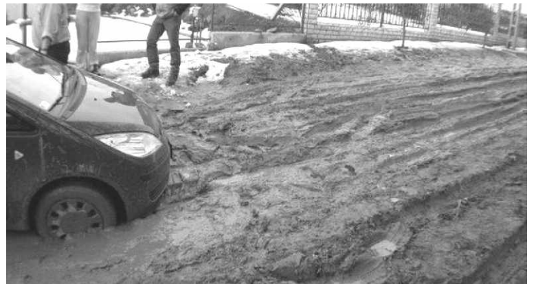
Egy jellemző kép a szilasligeti úthelyzetről. 2006. február 20.