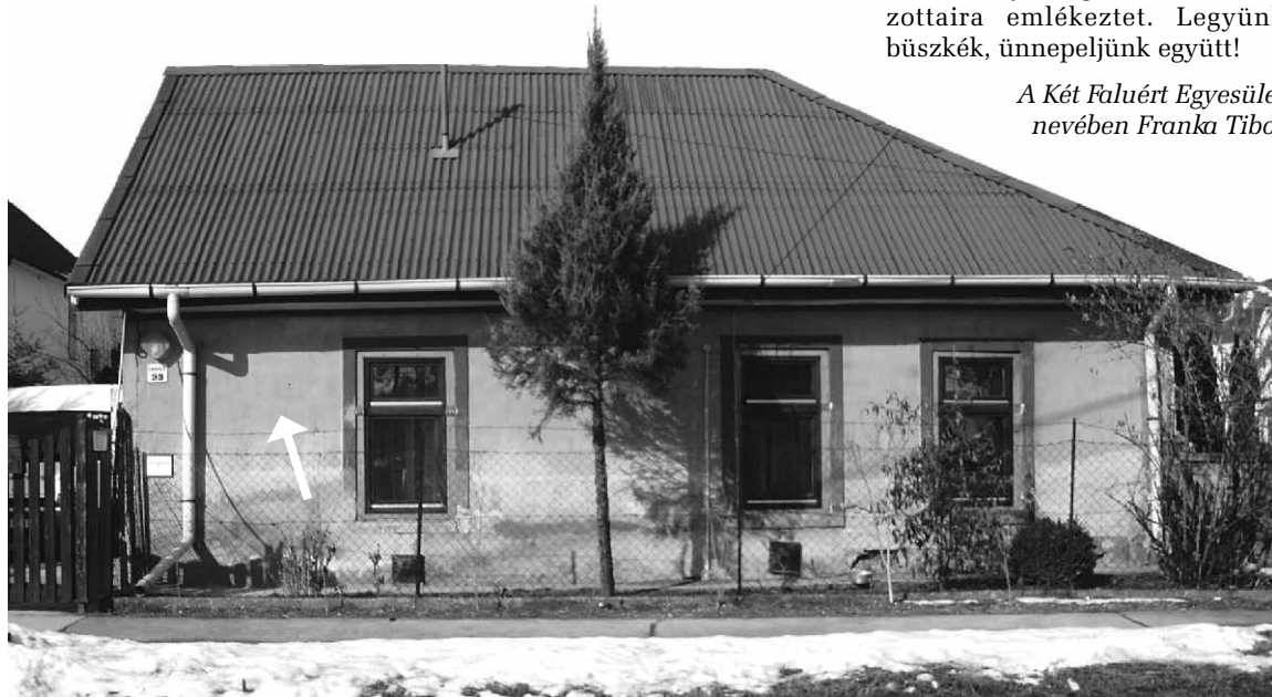
A csárda épülete Kerepes, Szabadság út 99. szám alatt. Az emléktábla helyét nyíl jelöli.