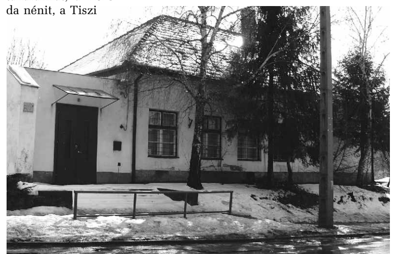
A kerepesi régi iskolánk szocreál maradéka