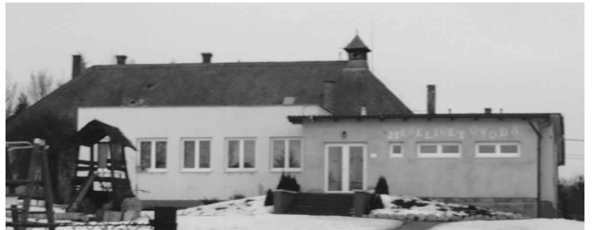
A századfordulón épült szilasi iskolát szocreál tömbökkel kerítették körbe okos tervezők.

plébánost, a társaimat, a barátaimat, a szüleimet, akiknek igazából köszönhetem mindazt, amit elértem. Legyünk büszkék, van mire, és ne járjunk behűzött nyakkal a falu, meg a főváros utcáin. Múltunk és emlékeink bearányozzák a napot akkor is, ha borús az ég. Nincsen kis teljesítmény, meg nagy teljesítmény, csak teljesítmény van. Az egyik ember többet bír, többet ér el, a másik embert akkor sem szabad lenéznie, sőt... Kerüljenek elő a vasalt blúzok, és fehér ingek, a fejkendők, a rakott szoknyák, a ragyogó csizmák, és öltöztessük hozzá a lelkünket is. Magam, erre tanítom a leendő újságírókat is az iskolában.