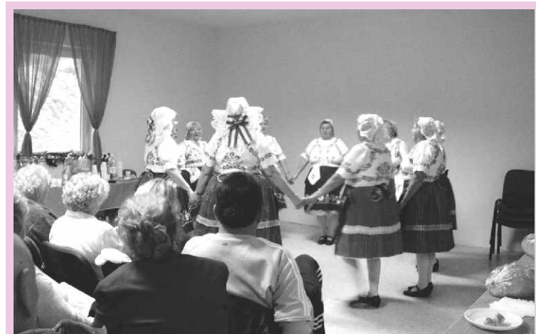
A képviselő nem tisztelt meg bennünket jelenlétével, mégis szélsőségesnek minősítette azt az évbúcsúztatót, amelyen előadók, támogatók és közönség jókedvűen szórakozott. (2005. december 17.)

Azt szeretnénk, ha ebben Erhardt Csaba is részt venne, de azt kérjük tőle, először is gyako-