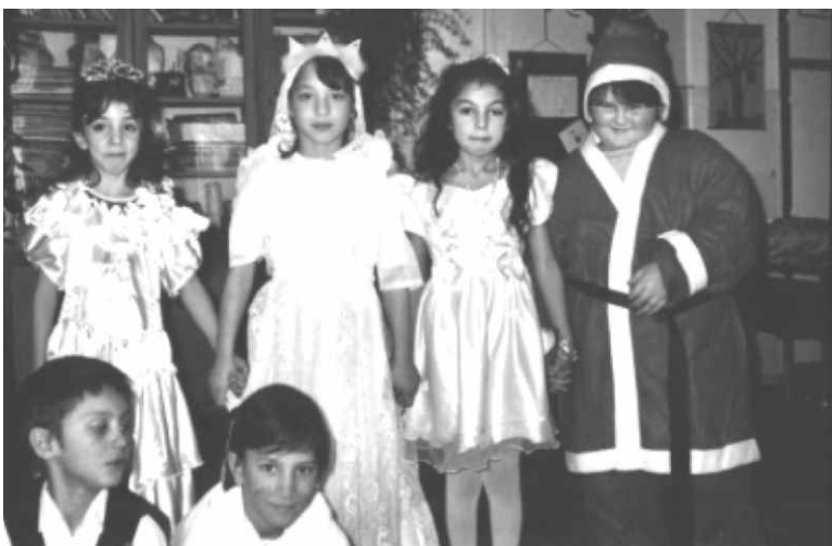
Jelmezben nem látszanak a gondok.