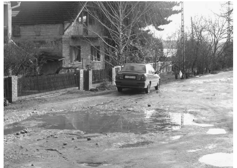
Íme az eredmény!