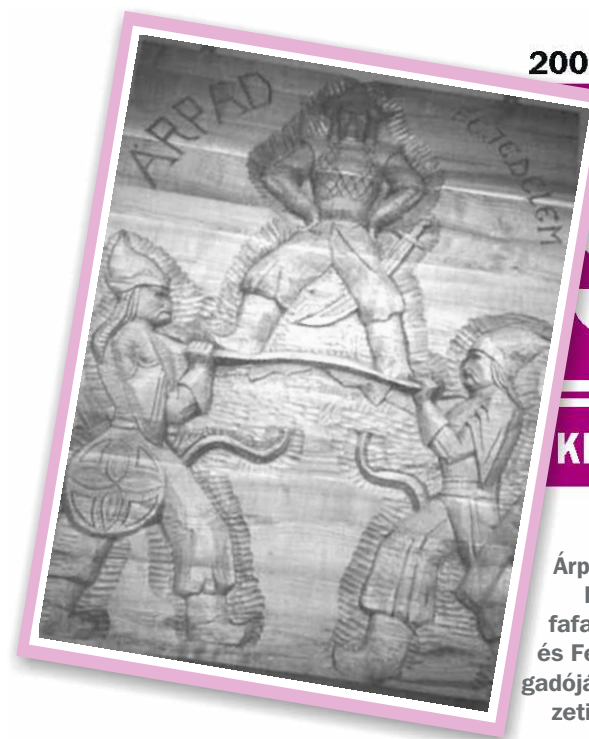
A képen látható Árpád pajzsra emelését egy erdélyi fafaragó készítette, és Ferenczi Lajos fogadóját, a Patkó nemzeti ivó falát díszíti.